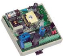
Mains unit on DIN rail